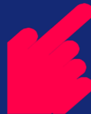
Evitar la fractura digital