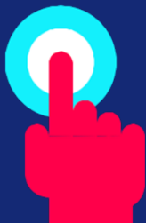
Promoció de la tecnologia Blockchain

La Fundació Nord és una entitat sense ànim de lucre ubicada a la ciutat de Girona que neix amb l'objectiu d'impulsar i implementar les noves tecnologies i, en especial, la tecnologia Blockchain, des d'un punt de vista ètic i treballant per a la reducció de la fractura digital.